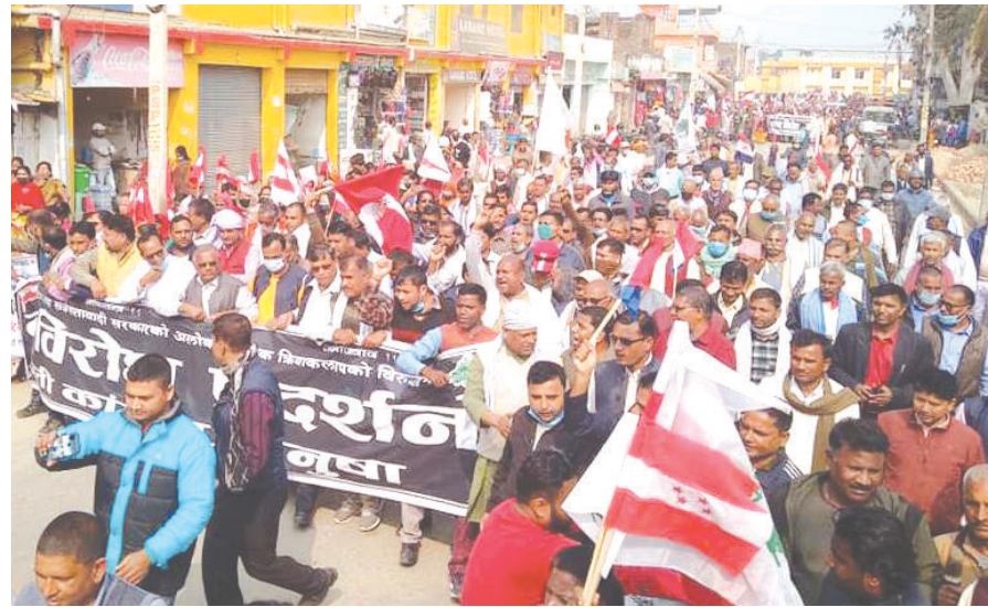
जनकपुरमा प्रदर्शन गर्दै काँग्रेसका नेता कार्यकर्ता।