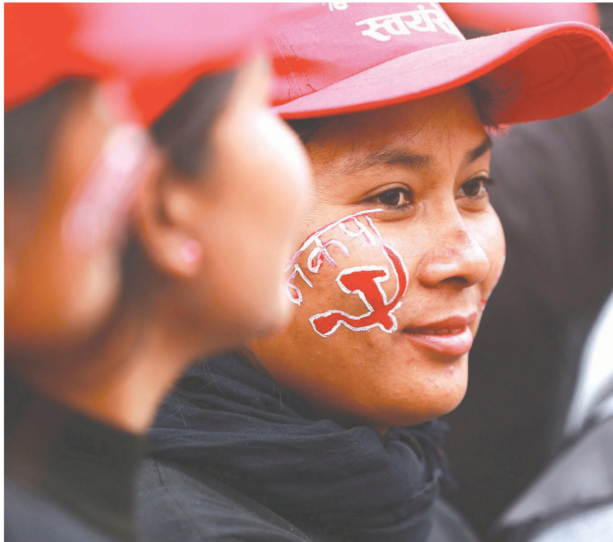
प्रचण्ड-नेपालका कार्यकर्ता | सरकारले गरेको प्रतिनिधिसभा विघटनको विरोधमा नेपाल कम्युनिष्ट पार्टी (नेकपा) प्रचण्ड-नेपाल समूहद्वारा काठमाडौंमा आयोजित विरोध सभामा उपस्थित एक कार्यकर्ता। तस्वीर : प्रदीपराज वल्ल, रासस